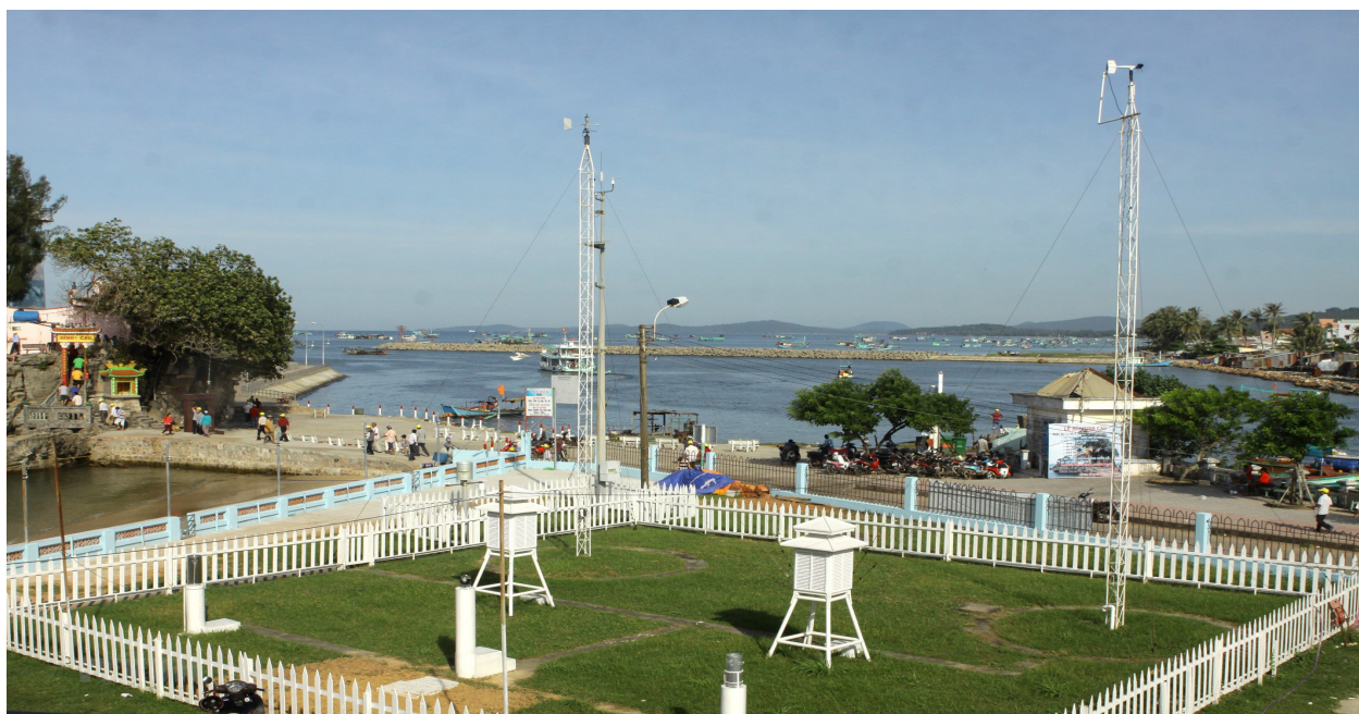
(Nguồn: Đài Khí tượng thủy văn Trà Vinh)