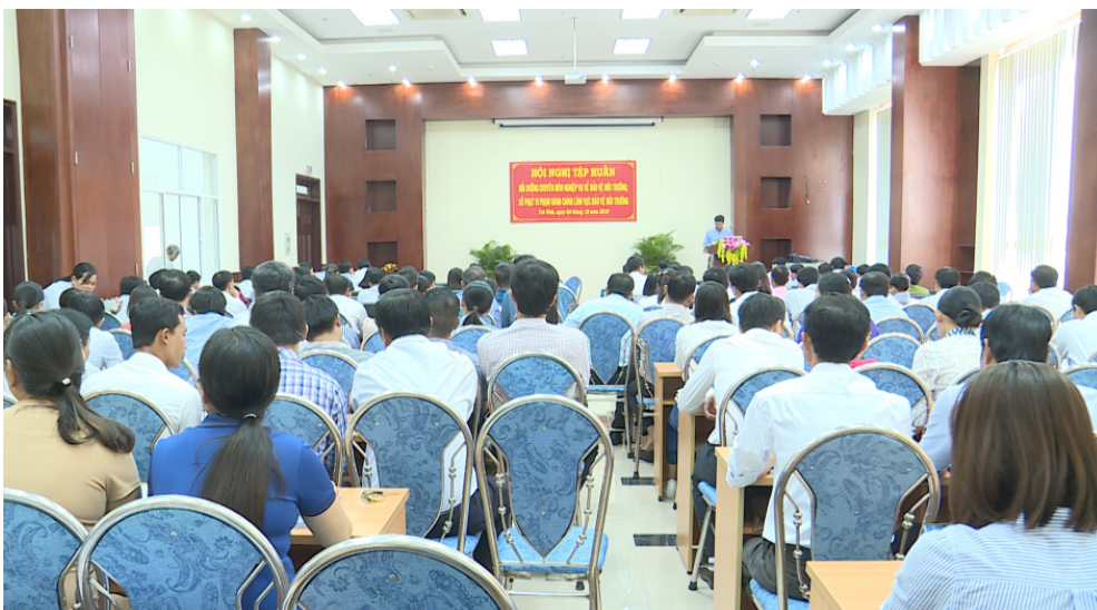
Quang cảnh buổi Tập huấn

Đây là dịp để các cấp lãnh đạo, cán bộ tài nguyên và môi trường trong tỉnh gặp gỡ, trao đổi, giải đáp vướng mắc về công tác bảo vệ môi trường và hướng dẫn nghiệp vụ xử phạt vi phạm hành chính lĩnh vực môi trường, quản lý chất thải rắn, lỏng, khí và tiếng ồn. Từ đó, đề xuất cơ chế, chính sách, biện pháp nhằm tăng cường quản lý nhà nước về hoạt động bảo vệ môi trường, xây dựng chiến lược phát triển kinh tế - xã hội xanh – sạch, an toàn và hiệu quả tại địa phương.