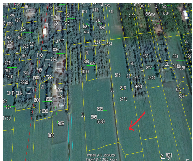
Kiểm tra hiện trạng sử dụng đất trên phần mềm Google Earth

Nhìn chung việc ứng dụng ảnh vệ tinh trên phần mềm Google Earth làm nguồn thông tin đầu vào giúp hỗ trợ cho nhiều công tác khác nhau trong lĩnh vực quản lý đất đai và là nguồn thông tin tham khảo nhanh chóng và tiết kiệm.