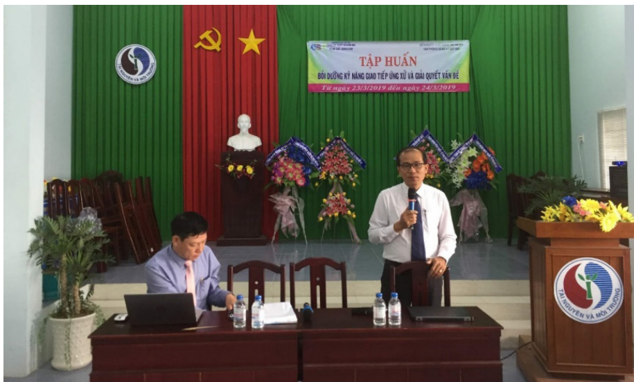
Khai giảng khóa tập huấn

Kết thúc khóa tập huấn Trung tâm nghiên cứu Khoa học và Sản xuất, Dịch vụ thuộc Trường Đại học Trà Vinh đã cấp Giấy chứng nhận đã hoàn thành khóa bồi dưỡng kỹ năng giao tiếp, ứng xử và giải quyết vấn đề cho tất cả các học viên.