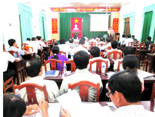
Hội nghị công bố quyết định điều chỉnh quy hoạch sử dụng đất đến năm 2020 huyện Cầu Ngang

- Phòng Tài nguyên và Môi trường tham mưu UBND huyện thực hiện thu hồi đất, giao đất, cho thuê đất, chuyển mục đích sử dụng đất theo điều chỉnh quy hoạch sử dụng đất đến năm 2020 huyện Cầu Ngang đã được phê duyệt.