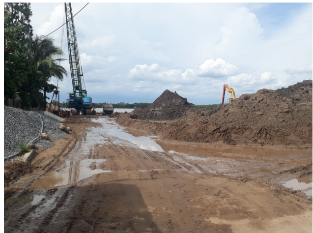
(Ảnh Minh Anh: Tổ công tác kiểm tra công tác bảo vệ môi trường tại Cơ sở sản xuất Than gáo dừa, xã Long Đức và Kho Vật liệu xây dựng Long Đức)

Sau các đợt kiểm tra tổng hợp kết quả kiểm tra, đề xuất Ủy ban nhân dân thành phố xử lý từng trường hợp, phân loại và tổng hợp danh sách các