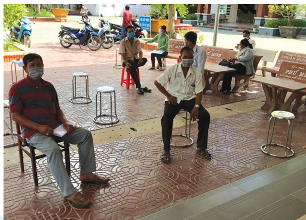
(Hình ảnh: Bố trí ghế ngồi đảm bảo giữ khoảng cách an toàn, nhắc nhở người dân rửa tay sát khuẩn.)

Thực hiện theo ý kiến Chỉ đạo về phòng chống dịch bệnh Covid – 19. Chi nhánh Văn phòng đăng ký đất đai huyện Châu Thành mỗi ngày tiếp nhận và giải quyết lượng lớn hồ sơ từng người dân có nhu cầu thực hiện các thủ tục đất đai, cụ thể tại Bộ phận Tiếp nhận và hoàn trả kết quả tại UBND huyện Châu Thành hàng ngày tiếp nhận hồ sơ và hướng dẫn thực hiện hồ sơ cho nhiều hộ dân, do đó công tác thực hiện phòng chống dịch Covid 19 hết sức được chú trọng và quan tâm. Chi nhánh Văn phòng Đăng ký đất đai huyện Châu Thành tiếp thu ý kiến chỉ đạo và triển khai thực hiện công tác chung tay phòng chống dịch bệnh Covid – 19 tại nơi làm việc.