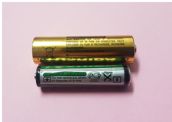
(Ảnh minh họa)