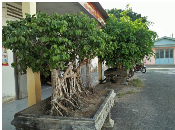
Một góc khuôn viên tại Chi nhánh văn phòng ĐKĐĐ Cầu Kè

Tổ trưởng chuyên môn thường xuyên kiểm tra, nhắc nhở thành viên trong tổ thực hiện tốt việc vệ sinh và trang bị cây xanh nơi bàn làm việc. Cuối quý I năm 2020 được sự đánh giá của lãnh đạo chi nhánh là các tổ đã thực hiện tốt kế hoạch của chi nhánh đề ra.