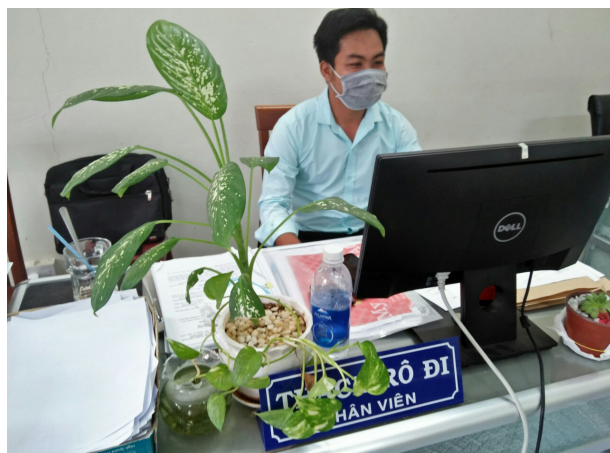
Bàn làm việc của nhân viên được trang trí bằng cây xanh