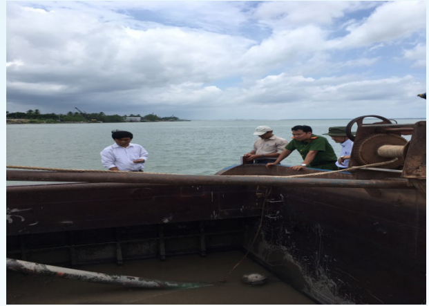
Bảo vệ lòng sông

tổ chức, cá nhân khai thác không trực tiếp vận chuyển sau khai thác; lắp đặt bảng thông báo tại bờ sông khu vực khai thác để công khai thông tin Giấy phép khai thác, dự án khai thác với các nội dung: tọa độ, diện tích và sơ đồ phạm vi khu vực khai thác; thời gian khai thác; tên, phương tiện, thiết bị sử dụng để khai thác cát, sỏi; Thực hiện nghĩa vụ, trách nhiệm về phòng chống thiên tai theo quy định của pháp luật. Trường hợp Giấy phép khai thác cát sỏi đã được cấp trước khi Nghị định này có hiệu lực thì phải thực hiện theo Khoản 1 Điều 9 Nghị định.