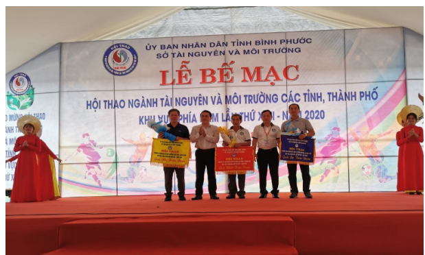
Đoàn Sở TNMT Trà Vinh Tham gia Khai mạc và bế mạc (Ảnh: Quốc Tuấn)