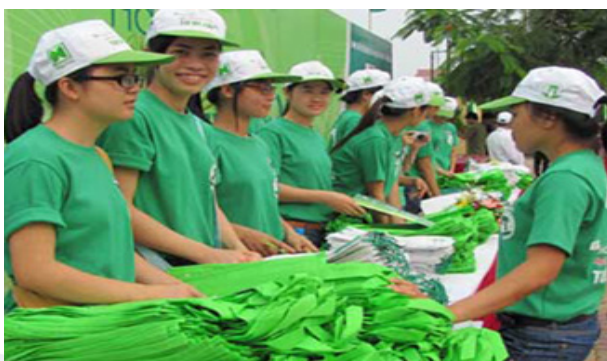
Lực lượng Đoàn thanh niên tham gia phát túi sinh thái cho người dân