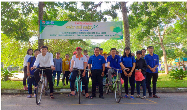
Đoàn thanh niên tham gia hưởng ứng phòng trào Chống rác thải nhựa

Thời gian tới, Sở Tài nguyên và Môi trường tiếp tục tham mưu, triển khai thực hiện các biện pháp hiệu quả nhằm giảm thiểu rác thải nhựa trong sinh hoạt trên địa bàn tỉnh.