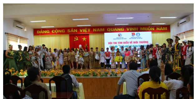
Các thí sinh trình diễn thời trang tái chế

Hướng đến một môi trường trong lành trong tương lai, xây dựng thành phố Trà Vinh là đô thị văn minh gắn với xây dựng cảnh quan, bảo vệ môi trường, quyết tâm xây dựng thành phố Trà Vinh xanh - sạch - đẹp, an toàn, thân thiện, đáng nhớ thì rất cần hướng đến nền giáo dục vững chắc, cần lắm những buổi tuyên truyền hữu ích, góp phần xây dựng một hạt giống tương lai của đất nếm hiểu các quy định về bảo vệ môi trường, đặt biệt là các hoạt động về hưởng ứng phong trào chống rác thải nhựa trên địa bàn.