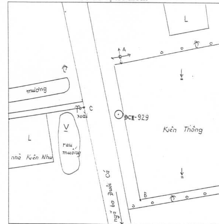
Sơ đồ vị trí điểm