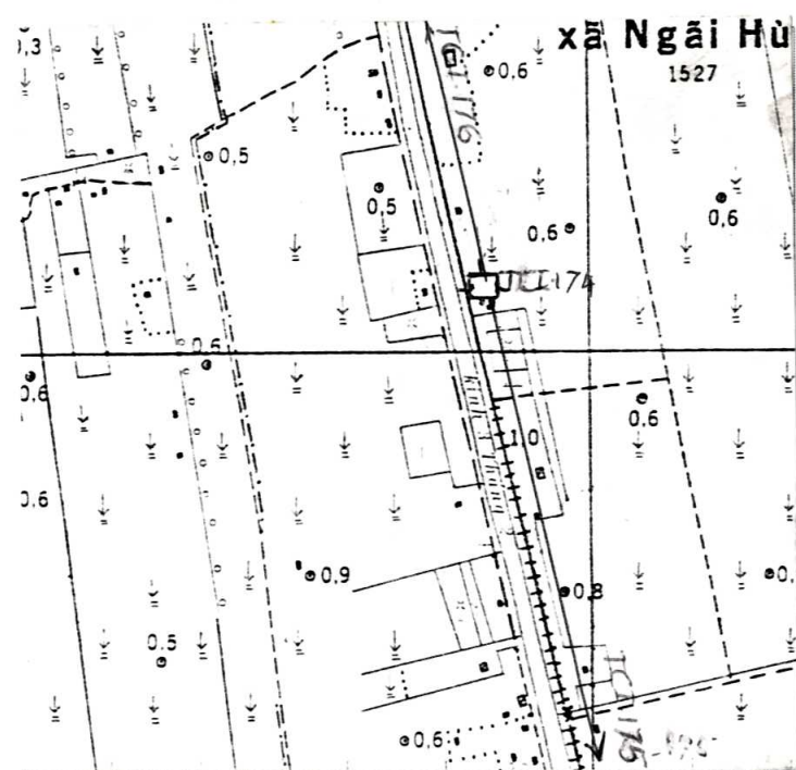
Bản đồ địa hình khu vực điểm và sơ đồ hướng