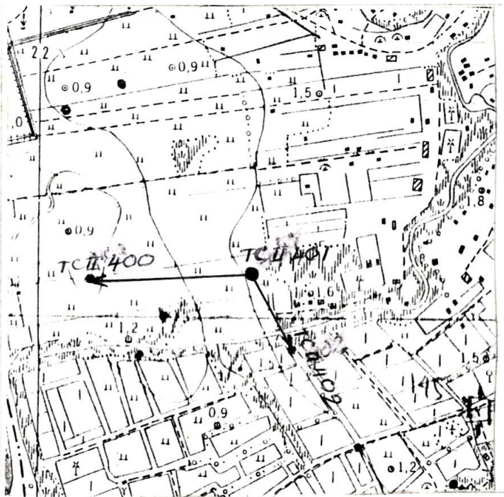
Tỷ lệ : 1/10000

Bản đồ địa hình khu vực điểm và sơ đồ hướng